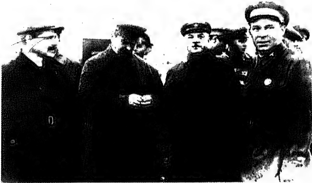
ستالين وإلى يساره المارشال فوروشيلوف وكبار ضباط الطيران.